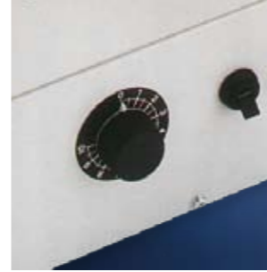
De snelheid van de Mercure is variabel: tot 18.000 stuks per uur. Naar eigen wens en per situatie af te stellen.